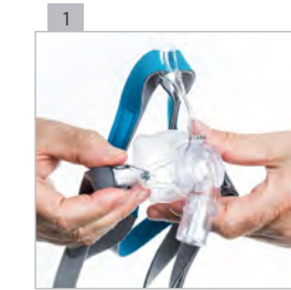
Снимите с маски оба зажима.