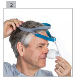
Наденьте оголовье на голову.