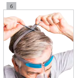
Отрегулируйте оголовье на голове так, чтобы оно внизу не касалось мочек ушей.