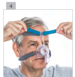
Установите верхние оголовья как можно свободнее, но настолько прочно, как это требуется.