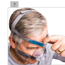
Установите налобник как можно свободнее, он не должен прилегать.