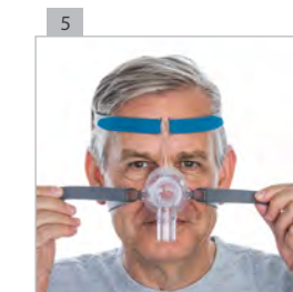
Установите нижние наголовники как можно свободнее, но при этом настолько прочно, как это требуется.