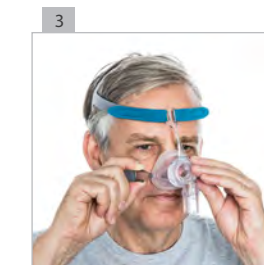
Закрепите зажимы снизу на маске.