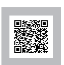
Наш видеоролик для пользователей имеется в YouTube.